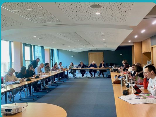
Rencontre avec le Président C.Coail et les élus de la majorité du Conseil départemental à Saint-Brieuc