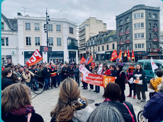
Célébration du 8 mars, pour le droit des femmes