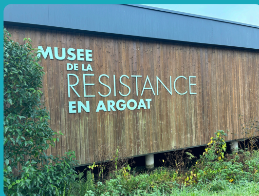
AG de l'Association de Gestion du Pôle d'Animation et de Mémoire de l'Etang-Neuf à Saint-Connan