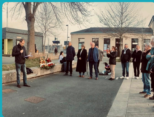
À la cérémonie commémorant les 83 ans de la disparition de Pierre Semard