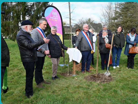
À la cérémonie d'hommage aux donateurs d'organes à Quévert