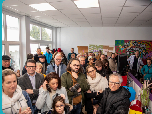
À la célébration de la fin de travaux à la Maison Escargot